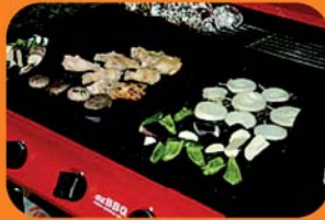
鶏・スペアリブ・野菜