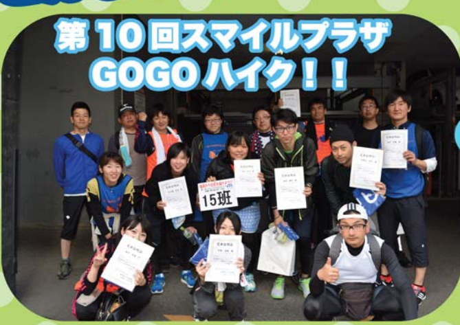
第10回スマイルプラザ GOGOハイク！！